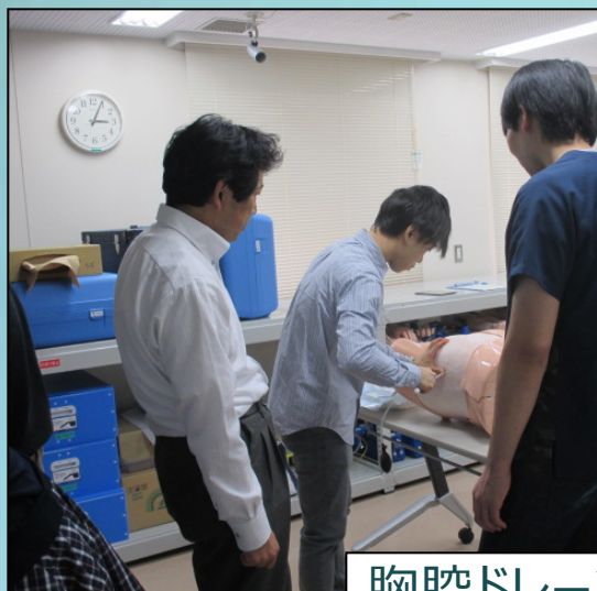
胸腔ドレーン実習