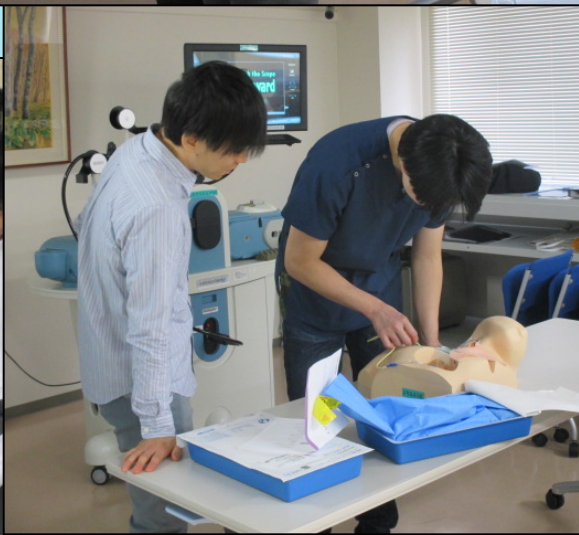
中心静脈穿刺実習