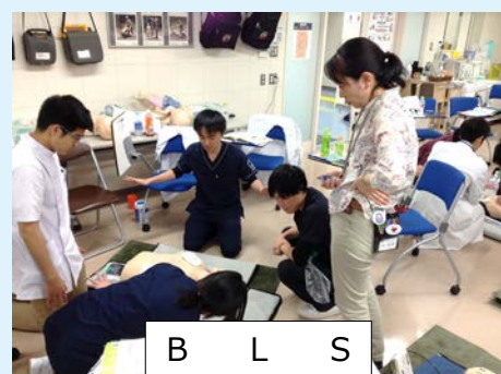
B L S