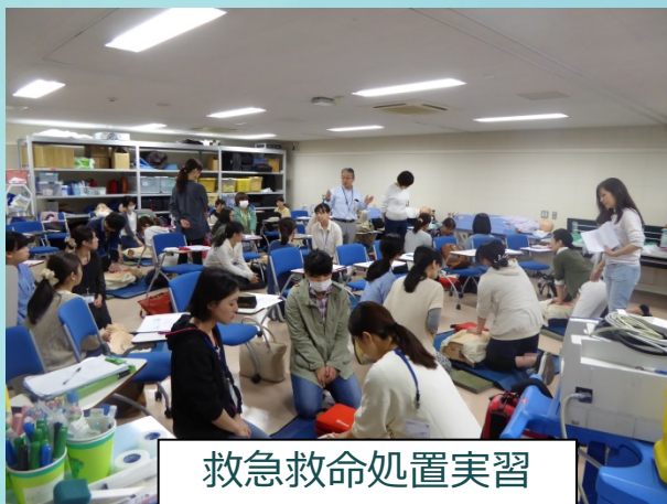
救急救命処置実習