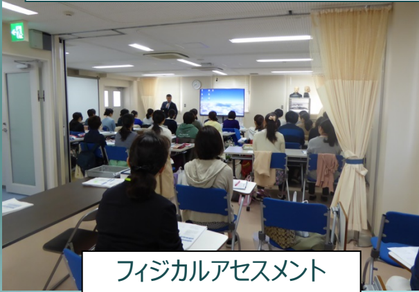
フィジカルアセスメント

市 中病院の新入職看護師を対象にシミュレータを使用した研修会を実施し、第1回32名・第2回33名の参加が有りました。