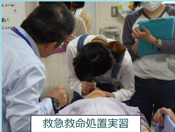
救急救命処置実習