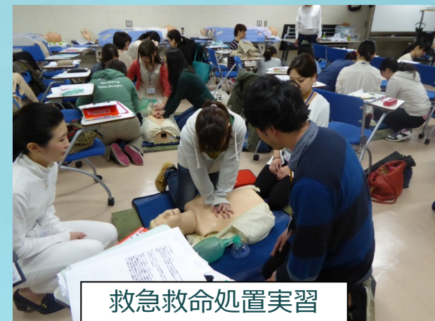
救急救命処置実習