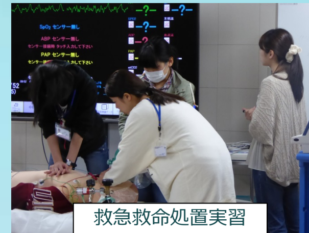
救急救命処置実習